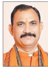
अस्पताल भवन के निर्माण के लिए शेष 22 करोड़ 59 लाख रूपए की मिली स्वीकृति